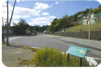
左 豊中市、右 吹田市の分岐点