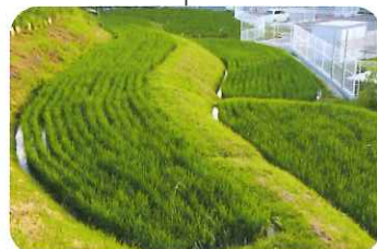
小さな棚田ですが癒やされます (^o^)* (泉丘小学校の東門の前)