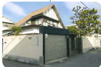
山田洋次監督の生家 (3歳まで過ごされました)