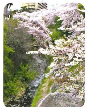
ちょっとした穴場です。 場所は秘密です。