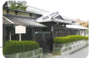
明治33年に建てられた旧新田小学校