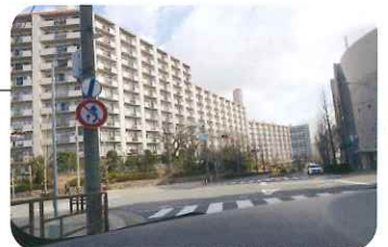
マンションの向かいは桃山台駅 (吹田市) です