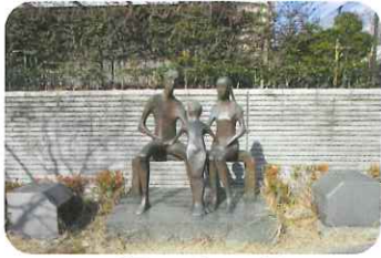
千里アートロード (オフィス街のオアシス)