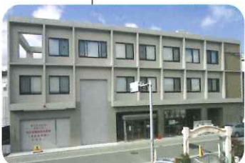
地域共生センター (旧福祉会館)