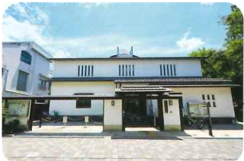
ふれあいも楽しい伝統芸能館※