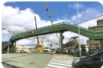
今はもう見られない風景 (八坂橋立橋)