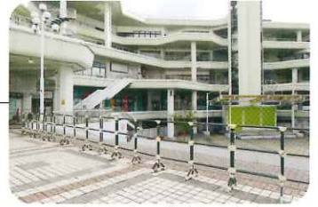
多くのスターが育ちました (旧千里セルシー)