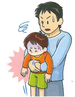
図2:腹部突き上げ法(幼児)