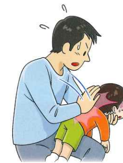
図1:背部叩打法(幼児)