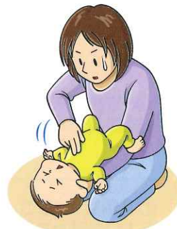
図4:胸部突き上げ法(乳児)