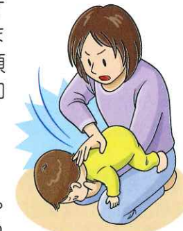
図3:背部叩打法(乳児)