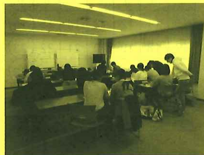
裏面に実施日カレンダーがあります