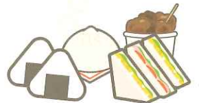
弁当、サンドイッチ、惣菜

過ぎたら食べないほうがよい期限(use-by-date) 定められた方法により保存した場合、腐敗、変敗、その他の品質(状態)の劣化に伴い安全性を欠くこととなるおそれがないと認められる期限。