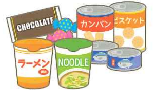
菓子、カップめん、缶詰