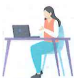
就労支援スペース 「すてっぷα」