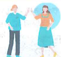
とよなかフリーランス MEETコミュニティ