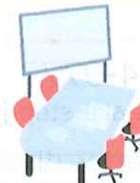
貸ホール 貸会議室