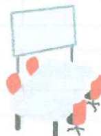
貸ホール 貸会議室