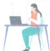
就労支援スペース 「すてっぴα」