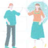
とよなかフリーランス MEETコミュニティ