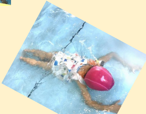
こんなことが できるようになりました♪