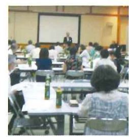
講演内容 家庭教育支援チーム「ほっこり」の事業について

講師: 能勢町子どもの未来応援センター職員 家庭教育支援チーム「ほっこり」家庭教育支援員