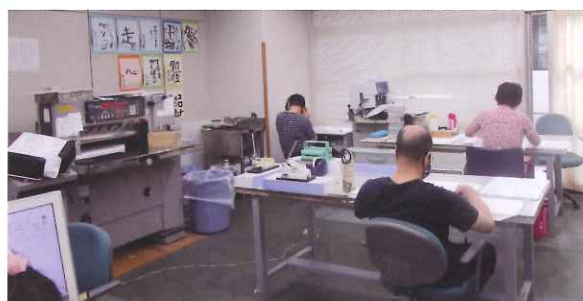
就労継続支援の活動風景

1階は就労継続支援。あすなるでは一人ひとりの障がいの違いを受け入れ、作業訓練だけでなく日常生活や社会生活訓練を大切に就労を目指しています。また1階生活介護では、利用者の希望を基に、製麺班、印刷班、軽作業班の3班に分かれて作業をします。ステップル作業は本当に細かい作業、シュレッダー