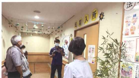
短期入所施設見学の様子