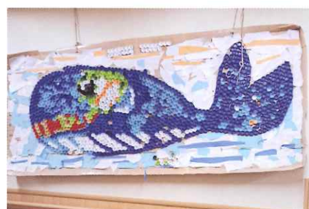
ペットボトルのキャップを使った作品

2階生活介護の日中活動スペースは広く、利用者の障がいの状態によりグループ分けをし、活動内容や場