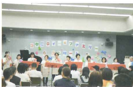
第3民児協 主任児童委員による手作りのコンサートです