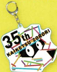
アクリルキーホルダー