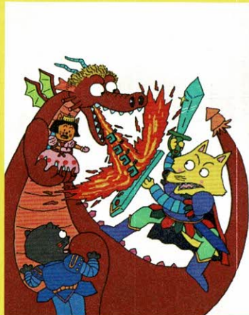
『かいけつゾロリのドラゴンたいじ』1巻(1987年)