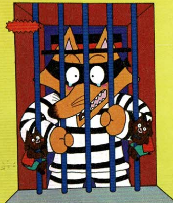
『かいけつゾロリつかまる!!』15巻(1994年)