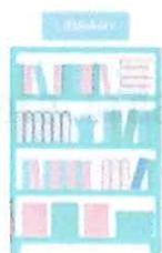
情報ライブラリー