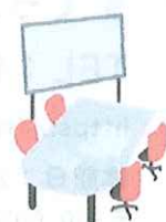
貸ホール 貸会議室