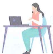
就労支援スペース 「すてっぷα」