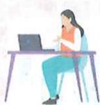
就労支援スペース 「すてっぷα」