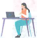
就労支援スペース 「すてっぷα」