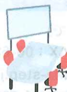
貸ホール 貸会議室